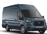
Blue Metallic Málmlitur