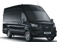
Agate Black Málmlitur