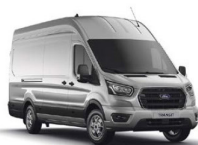
Moondust Silver Málmlitur